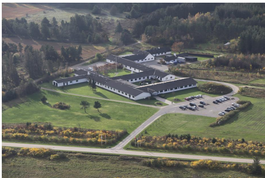
Centret set fra luften

Af yderligere muligheder kan vi anbefale vandreture i Fosdalen og Langdalen som ligger 3,5 - 4,5 km. Fra centret. Endelig er der kun 1,5 km. til stranden, hvor en spadseretur langs vandkanten altid er en oplevelse.